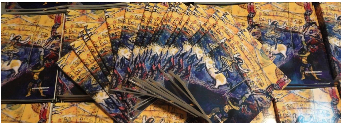
La primera edición del libro "Poesía Cirquera por Brunitus"

Me gustan los libros. Las historias escondidas en páginas gastadas, los universos que habitan en las bibliotecas. Siempre la ilusión fue que el proyecto se transformara en un libro. Que sea tangible, acariciable. Luego de mucho esfuerzo, dedicación y con la ayuda de amigos, en diciembre del 2014 se hizo la primera edición completamente independiente y alternativa. El libro tiene el espíritu del artista callejero, del artista de circo. Viaja conmigo. La venta es directa. El que atiende la boletería del circo es el trapecista, el que vende el libro es quien lo escribió. Son 18 textos míos y 16 textos de otros autores. Una recopilación envuelta en un cuadro de Chagall, un cuadro de circo, por supuesto.