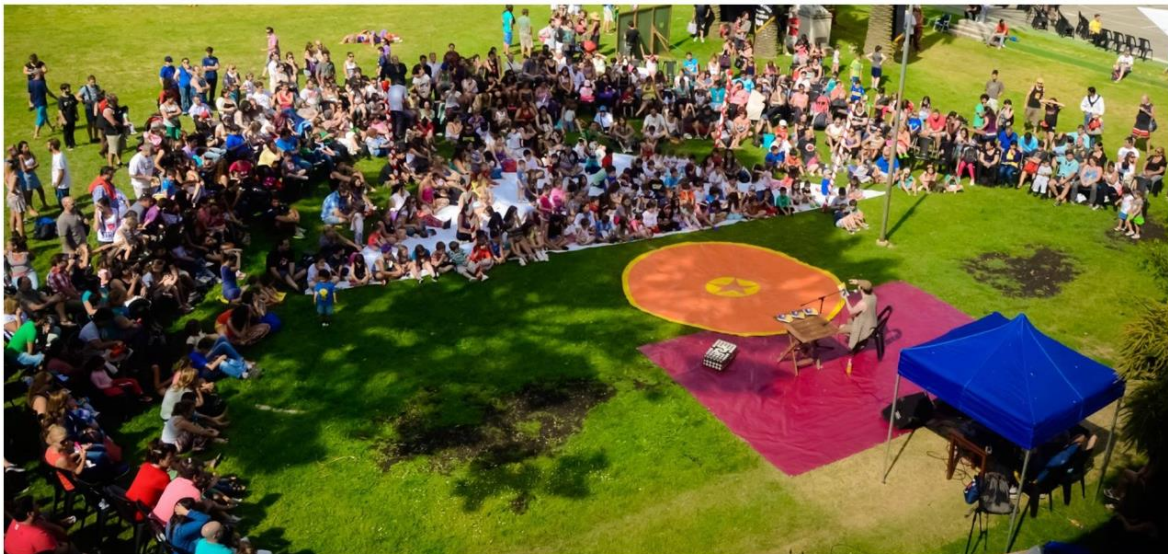
Presentación del libro en el Festival Hazmereir 2014 - Mar del Plata, Argentina.

Cada vez que hago espectáculos lo ofrezco a mi público y en los festivales se arma un espacio de lectura donde colegas y extraños se llevan su ejemplar.